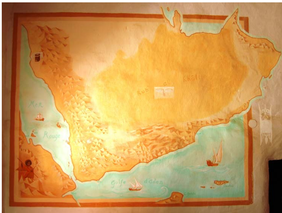
Carte de l'Arabie du Sud, hall d'administration du CEFAS